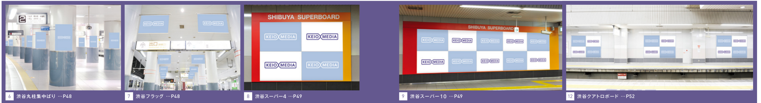
6 渋谷丸柱集中ばり …P48

一直線のシンプルな駅では、1日約36万人の乗降客を狙ったジャック展開が効果的です。