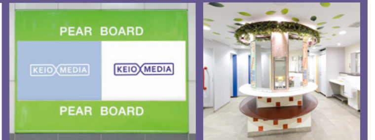
17 ペアボード …P57