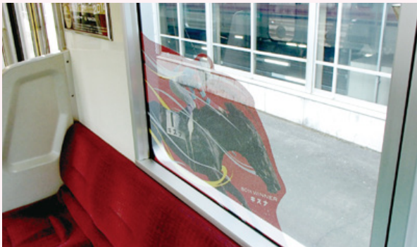
車内まで特殊シート