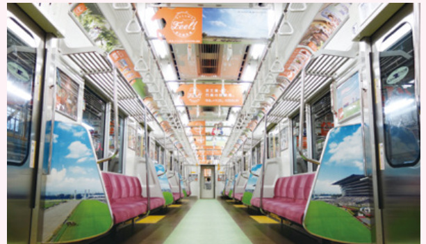
袖仕切り板シート貼り

〈特殊メディア注意〉※特殊メディアは事前に承認が必要となります。承認には内容により1週間～1ヶ月程度かかる場合がございます。※特殊メディアの作業日は土曜日もしくは日曜日となります。 ※使用素材などに指定がある場合がございます。詳しくはお問合せください。 ※掲出終了後は原状復帰をお願いします。