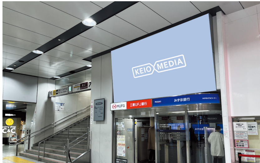
■ 掲出サイズ (単位:mm)