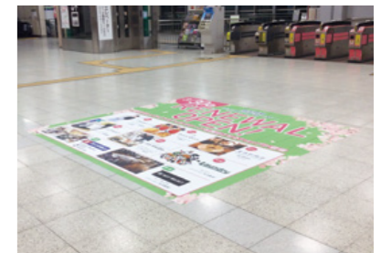
[ 府中駅 ] フロア広告