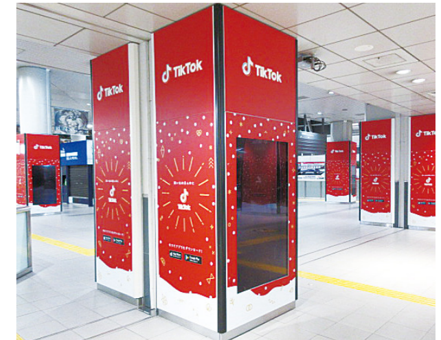
[ 渋谷駅 ] 渋谷K-DGウェーブBエリア 柱ラッピング