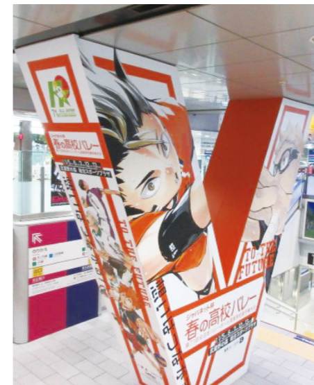
[ 新宿駅 ] 京王X階段V字柱ラッピング