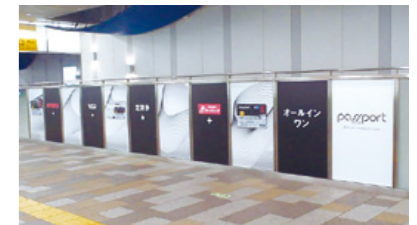
[ 調布駅 ] ガラスシートばり