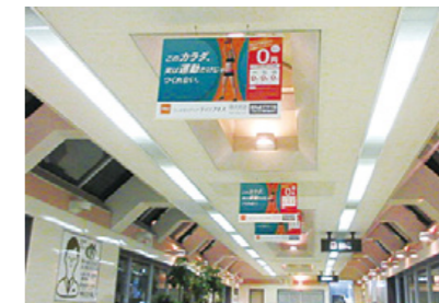
[ 明大前駅 ] コンコースフラッグ広告