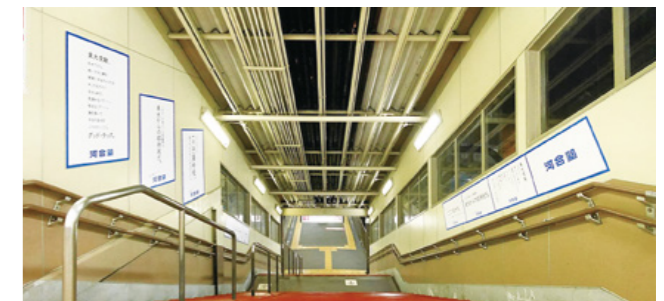
[ 駒場東大前駅 ] 階段横臨時集中ばり