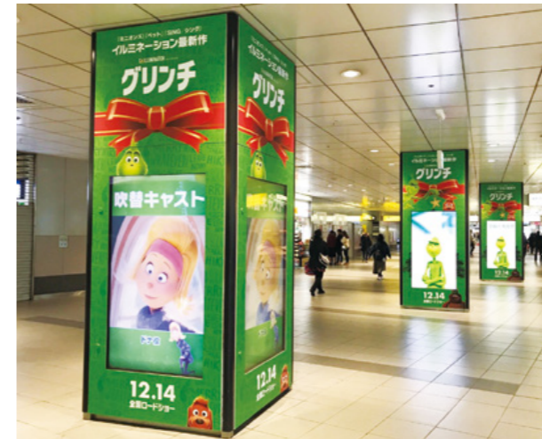
[ 渋谷駅 ] 渋谷K-DGウェーブAエリア 柱ラッピング