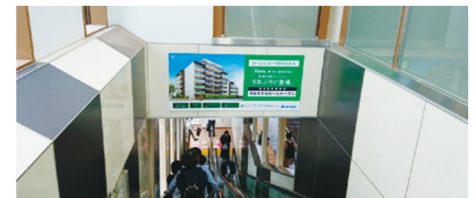
[ 武蔵野台駅 ] エスカレーターおでこシートばり