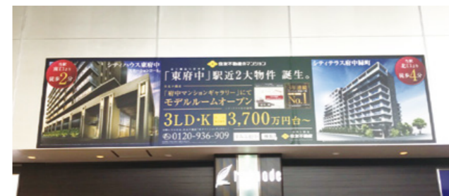
[ 東府中駅 ] 改札正面シートばり