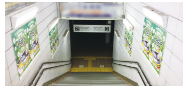
[ 飛田給駅 ] 階段横臨時集中ばり