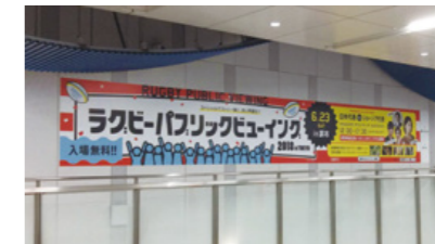
[ 調布駅 ] エスカレーター横シートばり