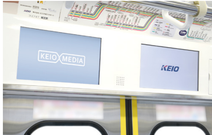
17インチ液晶モニター