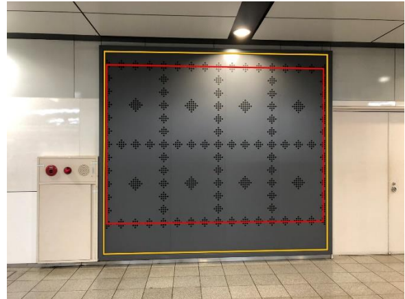
オレンジ枠=シート掲出サイズ